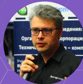
Владимир Христов BLACKMAGIC DESIGN